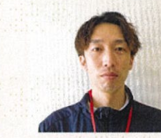
主任 小北 京佑 「家族が増えた事、子供の成長」