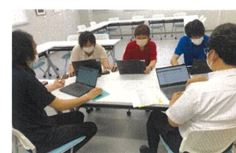
↑打ち合わせは、会議用のアプリを使用しPC上で情報の共有を図っています。

ハード面でも、タブレットやPCを追加し、記録入力の時間の確保や情報のデータ化を図っています。また、マットレスの下に専用のセンサーを設置し、睡眠状況（レム睡眠、ノンレム睡眠、呼吸数など）をデータとして作成できる「眠リスクキャン」も導入しています。これまでのデータ作成に充てていた時間を1時間程度は削減出来ています。どの取り組みも最初は操作が分からず、右往左往していましたが、慣れてくると今は手放せないものになっています。「業務の効率化＝働きやすさ」の考えの下、今後も見直しや新しい技術を取り込んで、人材の定着に結び