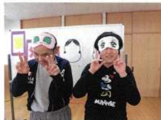
年女・年男のお二人が福笑いに挑戦