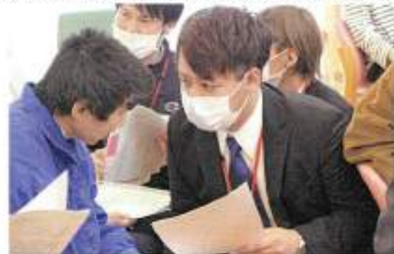
個別支援計画について説明をする様子