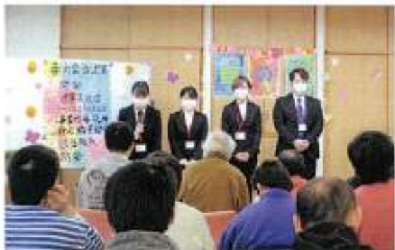
4/1 春の会にて、緊張した面持ちで挨拶する新任職員

春の会では利用者の方に向けて2020年度の事業計画や前期の個別支援計画の説明を行いました。また、新年度の担当職員の発表もあり、みなさん誰が担当になるのか楽しみにされていました。また、今年度も楽しく過ごせるようなイベントを実施しています。ホームページにも掲載していますので是非ご覧ください。