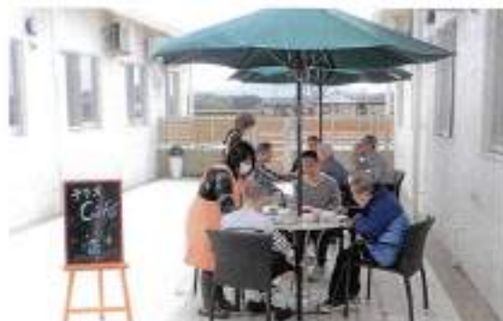
4/15 コロナ対策中でも楽しめる余暇としてテラスでカフェ♪