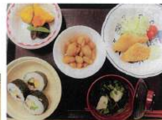
巻き寿司など節分仕様の昼食 (*^-^*)