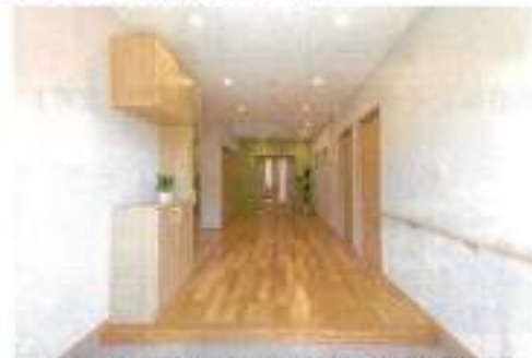
玄関を開けるとこのような光景が目飛び込んできます