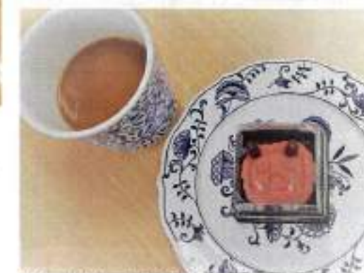
おやつは鬼の顔をした和菓子でした