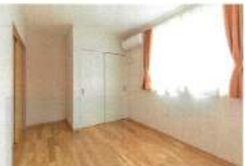
お部屋の様子。日当たりもばっちり、足元には常夜灯も完備