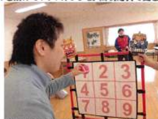
的を鬼に見立てたストラックアウト

節分会ではストラックアウトや福笑いをして楽しみました。最後に鬼が登場したので利用者の皆さんで鬼にカラーボールを投げてやっつけました。無病息災で過ごせそうです。