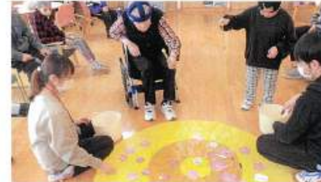
花びら釣りゲームの様子