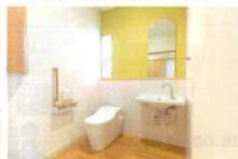
トイレの内装にも匠のこだわりが伺えます