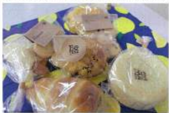
4/22 テラスカフェでは、(福)三気の会の就労継続支援B型事業所BeTREEのオシャレなパンを美味しく頂きました！