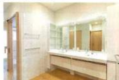
女性にはうれしい広々とした洗面台