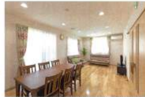
開放感のある明るいリビング。利用者の方たちの憩いの場となるでしょう